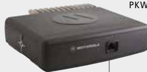
MONTAGE MIT ABGESETZTEM BEDIENTEIL PKW, RETTUNGSWAGEN, LÖSCHFAHRZEUG