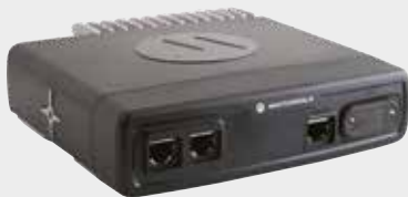
ETHERNET-ERWEITERUNGSKOPF 2X ETHERNET-STD, ETHERNET-SIM-LESEGERÄT UND RS232