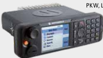
ARMATURENBRETT PKW, LKW