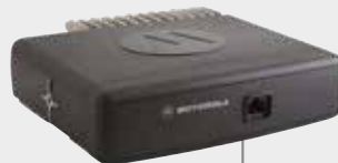
IP67-MONTAGE BOOT, MOTORRAD