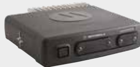
VERBESSERTER ERWEITERUNGSKOPF STANDARD-UND ZUSATZANSCHLUSS 25-POLIG UND RS232