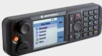
ETHERNET-REMOTE-BEDIENTEIL (RECH) UNTERSTÜTZT EXTERNE LAUTSPRECHER UND SPRECHTASTE